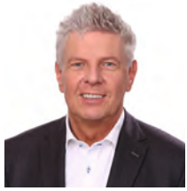
Dieter Reiter 迪特·莱特 Oberbürgermeister der Landeshauptstadt München 慕尼黑市长

Das Chinesische Filmfest München gehört mittlerweile fest in den Münchner Veranstaltungskalender. Und ich freue mich ganz besonders darüber, dass das 9. Chinesische Filmfest München auch in diesem Jahr im Gasteig HP8 und wie bereits im vergangenen Jahr auch online stattfindet.