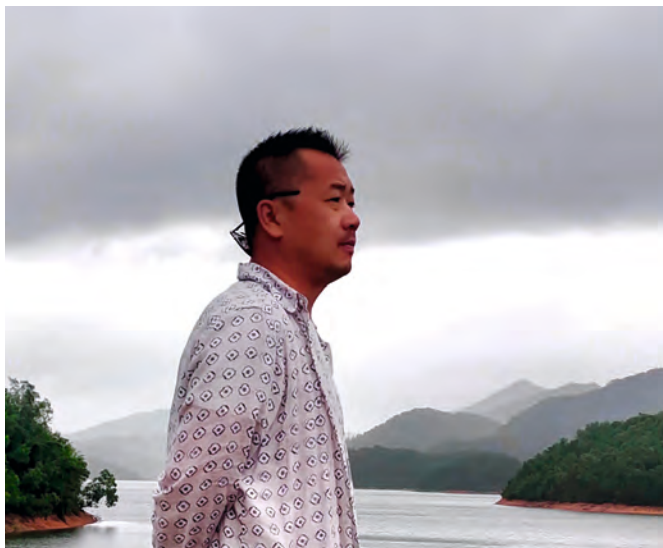
WEI Tie 卫铁 Kurator beim 9. Chinesischen Filmfest München 第九届慕尼黑华语电影节艺术总监

WEI Tie (卫铁), Jahrgang 1979, erwarb seinen Abschluss an der Filmakademie in Peking und steht seit 2013 als Regisseur bei der China Film Group Corporation unter Vertrag.