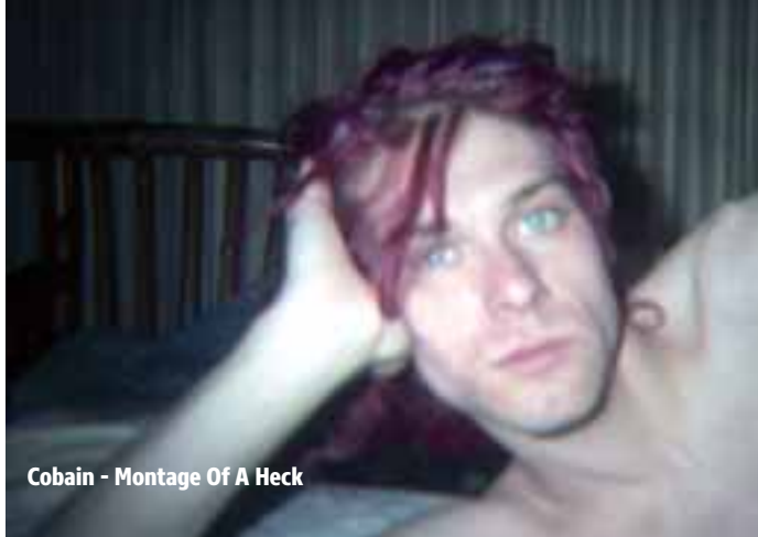
Cobain - Montage Of A Heck

Termine: Ab 14.05.2015 in den Breitwand-Kinos