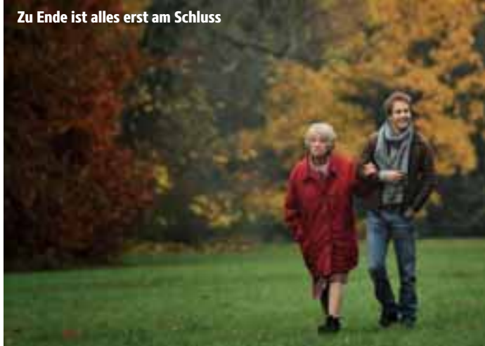
Zu Ende ist alles erst am Schluss