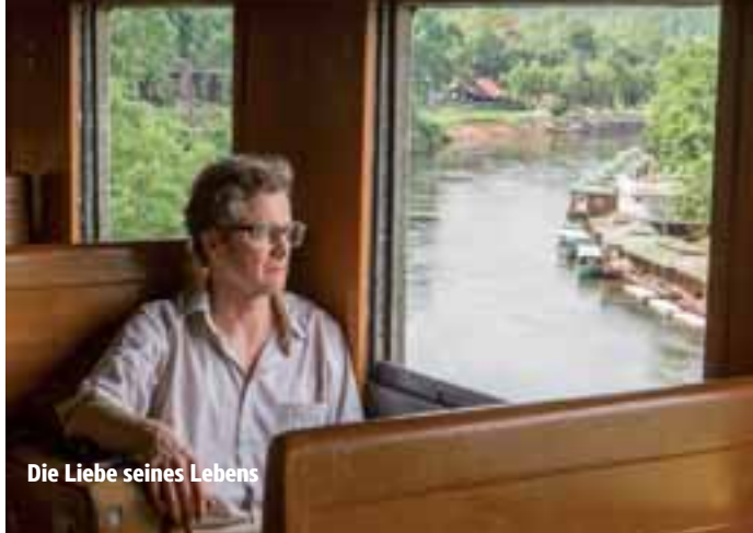
Die Liebe seines Lebens

AUS/GB 2014 108 Min. Regie: Jonathan Teplitzky Darsteller: Colin Firth, Nicole Kidman, Jeremy Irvine Termine: Ab 25.06.2015 in den Breitwand-Kinos