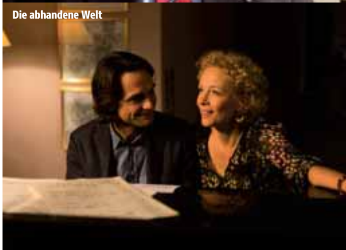
Die abhandene Welt