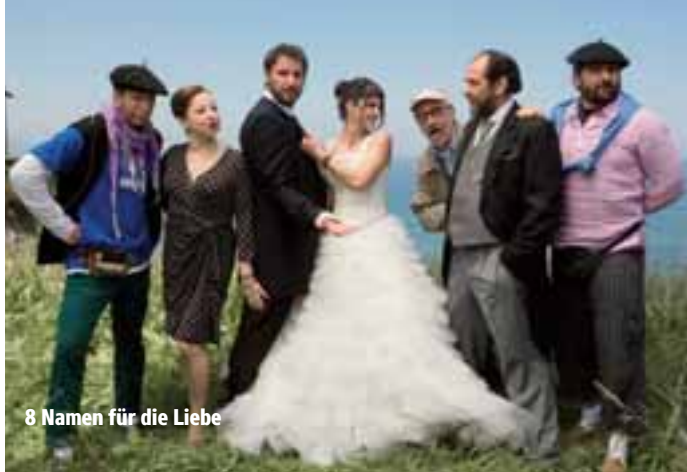
8 Namen für die Liebe

Termine: Ab 11.06.2015 in den Breitwand-Kinos