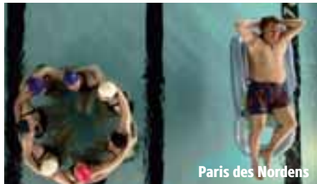
Paris des Nordens

Ruhe, Schönheit, ein kleines Dorf im Westen Islands. Lehrer Hugi hat sich hierhin zurückgezogen. Die einzigen Bezugspersonen des verkorksten Mittdreißigers sind die beiden anderen Mitglieder der örtlichen Anonyme-Alkoholiker-Gruppe. Doch die Beschaulichkeit hat ein Ende, als sein Vater Veigar, von dem er seit Jahren nichts gehört hat, überraschend seinen Besuch ankündigt. Vater und Sohn sind nicht unbedingt das, was man kompatibel nennt. Thailand-Heimkehrer Veigar ist der junggebliebene Lebemann, außerdem ein passionierter Biertrinker. Doch nach erheblichen Startschwierigkeiten erkennen sie eine Gemeinsamkeit, wenigstens eine.