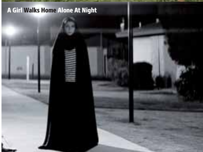
A Girl Walks Home Alone at Night