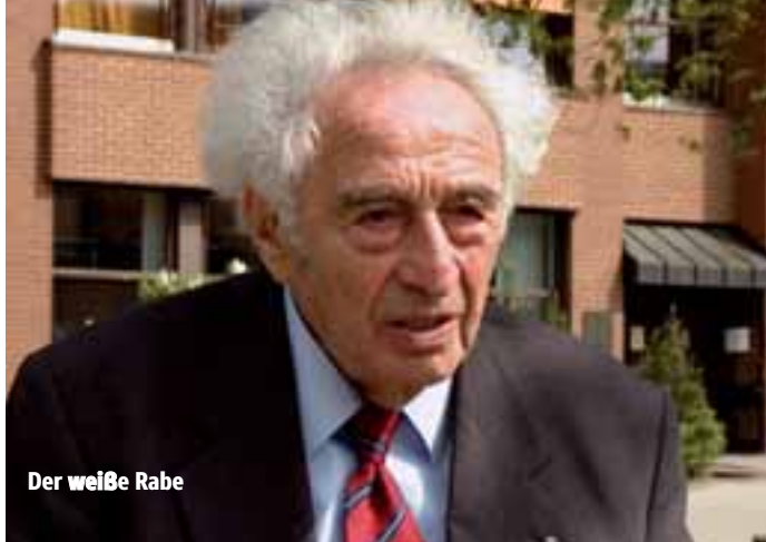
Der weiße Rabe

Termine: Weiter ab 14.05.2015 in den Breitwand-Kinos