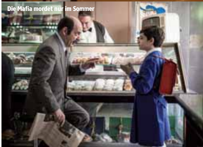
Die Mafia mordet nur im Sommer