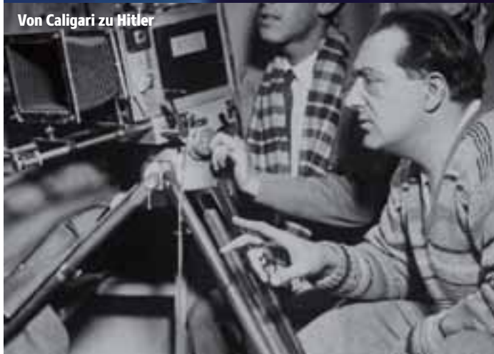
Von Caligari zu Hitler