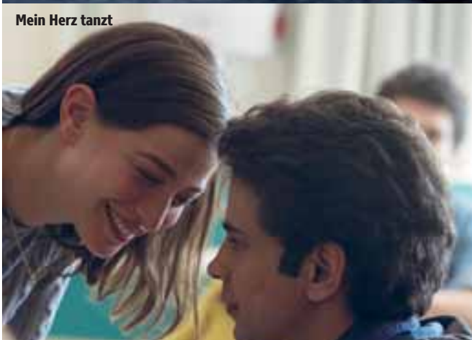
Mein Herz tanzt