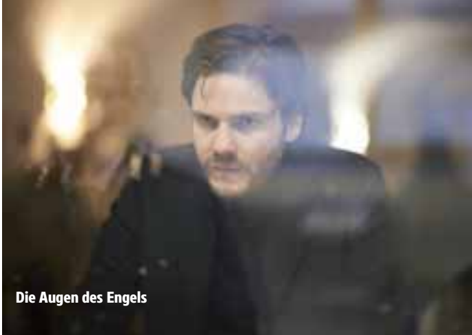
Die Augen des Engels

Termine: Ab 21.05.2015 in den Breitwand-Kinos