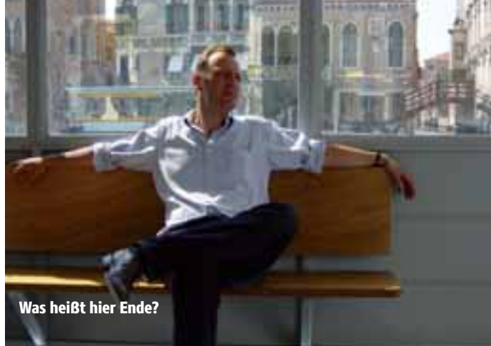
Was heißt hier Ende?

Termine: Ab 18.06.2015 im Kino Breitwand