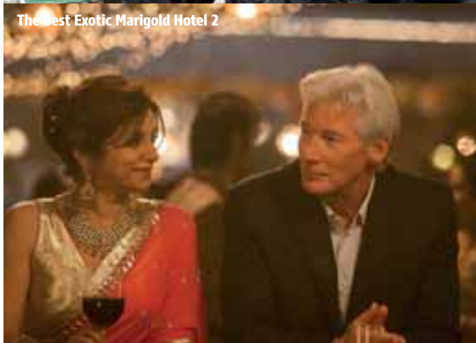
The Best Exotic Marigold Hotel 2

D 2014 90 Min., FSK ab 0 Jahren Regie: Walter Steffen Darsteller: Wally Warning & Wolfgang Ramadan Zwoasto, Unterbibberger Hofmusik