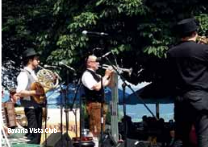
Bavaria Vista Club

Blues auf Bayrisch, Volksmusik plus Jazz, Gstanzl plus Reggae - oberbayerische Musik ist manchmal bunter als die Polizei erlaubt. Dies dokumentiert Walter Steffens neuer Film. Er reflektiert die Historie und die Vielfalt der Avantgarde der oberbayerischen Volksmusik. Selten hat man so viele wunderbare, schräge, schlaue Bayern in einem Film gesehen: Sieben Bands und ihre Musiker, von der eher traditionellen "Unterbibberger Hofmusik" bis hin zu den Ska-Gstanzlern von "Zwoasto", sind die Protagonisten des Films.