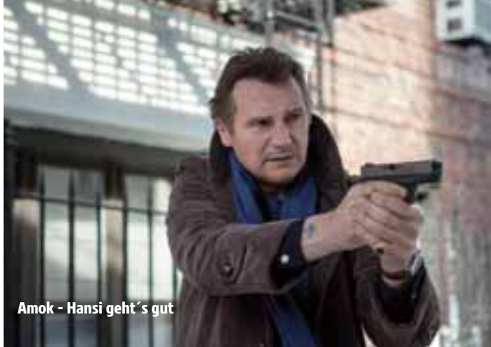
Amok - Hansi geht's gut

Termine: Ab 04.06.2015 in den Breitwand-Kinos