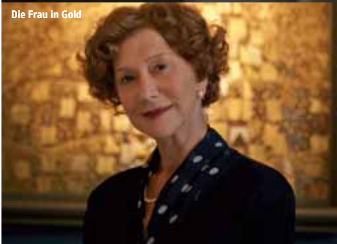
Die Frau in Gold