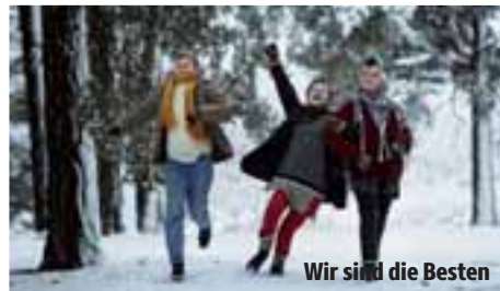
Wir sind die Besten

Fucking Stockholm! Ein wunderbarer, schwungvoller Coming-of-Age-Film über und in einer Zeit, in der feministische und politische Losungen das Alltagsleben bestimmen. Lautstark, witzig und vor allem stimmig in der Zeichnung der drei Teenager-Mädchen, die Anfang der 80er Jahre die Straßen der schwedischen Hauptstadt unsicher machen. Bobo und Klara, zwölf Jahre alt, beherrschen zwar keine Instrumente, wollen als Musikerinnen aber ernst genommen werden. Deshalb gründen sie ausdrücklich eine Punkband und nicht etwa eine „Girlgroup“. Dritte im Bunde wird die wohlbehütete Hedvig, die sie als klassische Gitarristin beeindruckt hat. Und sie sollen nun ein „Weihnachtskonzert“ bestreiten.